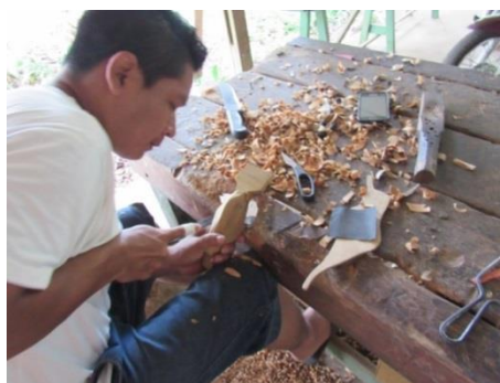
Figura 3: Artesão entalhando

produção incorporou também utilitários e peças decorativas feitos de forma manual e de maneira simples pelos artesãos da comunidade (AUZIER, 2012).