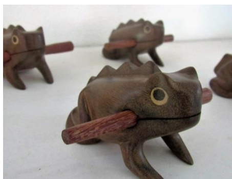
Figura 02: Sapo cantador.